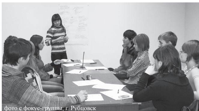
фото с фокус-группы, г. Рубцовск

Нет, это не исповедь и не откровения молодежи, не обычные жалобы на жизнь, это ее рассуждения, мысли, аргументы «за» и «против», если хотите – разговор за жизнь о жизни.