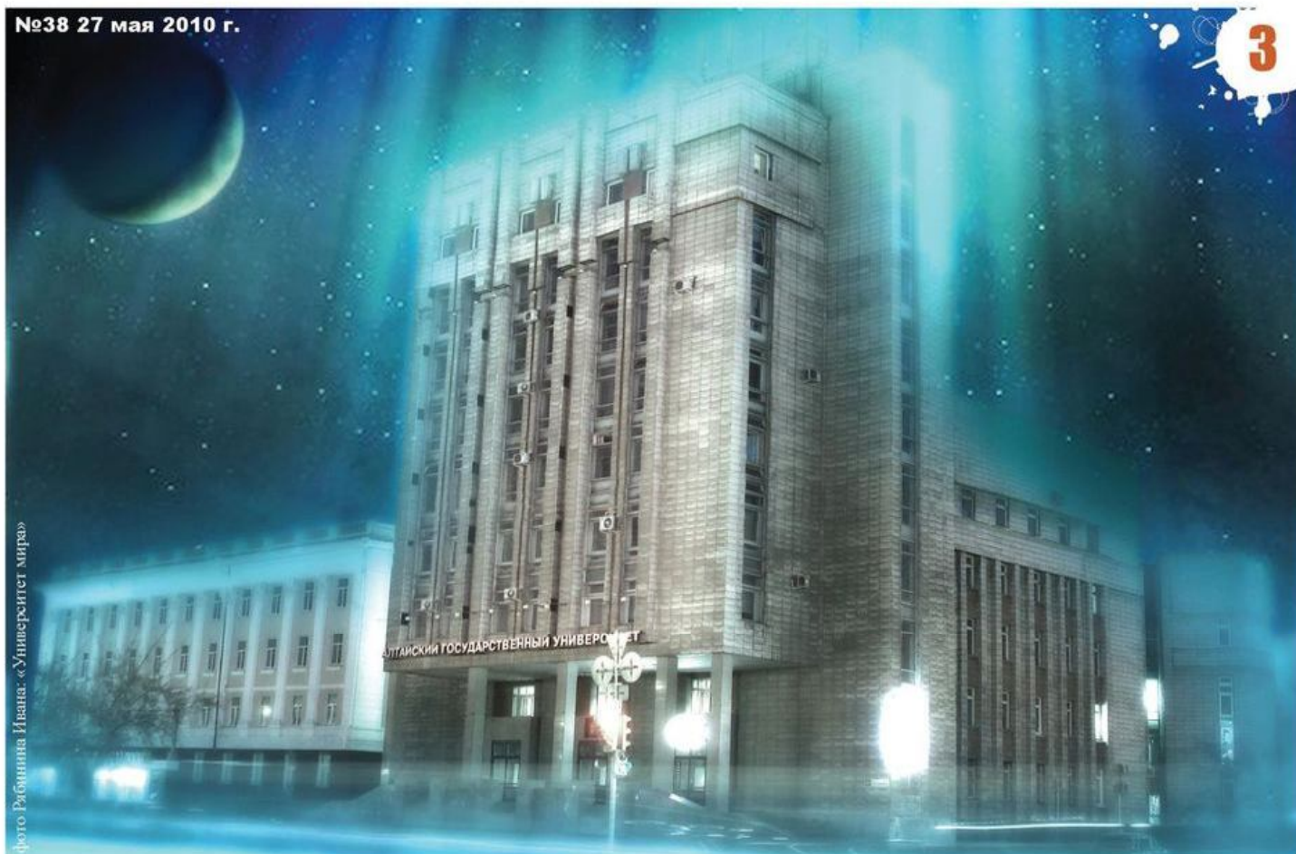
«Университет мира»