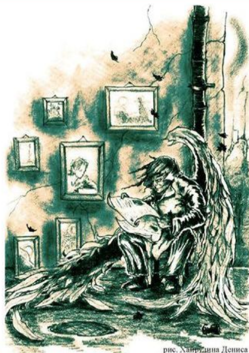
рис. Хаврудина Дениса